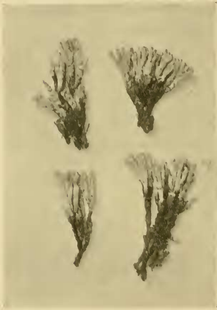
Fig. 1. Cladonia Trapezuntica Stnr. Vergr. ca. 2.

Planta sterilis, ad Cl. papillariam (Ehrh.) Hoffm. arcte accedens. Thallus primarius in speciminibus collectis non adest, evanescit igitur. Podetia dense caespitose crescentia, ad 1.5 cm alta, infra emorientia et denigrata, supra diutius accrescentia et dilute glaucae viridia, teretia, non squamosa nec sorediosa sed ubique levius v. distinctius nodulose inaequalia, ad 0.5 — vix 0.7 mm et ad ramificationes h. i. ad 1 mm crassa, infra remote dichotrichotome, supra (spat. ad 0.5 cm longo) dense scopaeforme, i. e. fastigiata ramosa, ramis erectis, gracilibus, ultimis dichotrichotomis, omnibus papillis fuscis clausis.